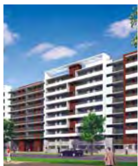
Jardines de Gorbea I Santiago