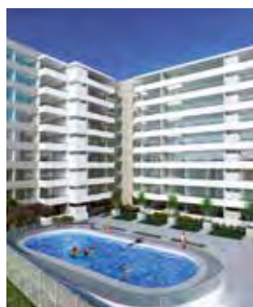
Jardines de Gorbea II Santiago