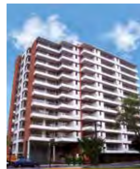
Gran Nobel Ñuñoa