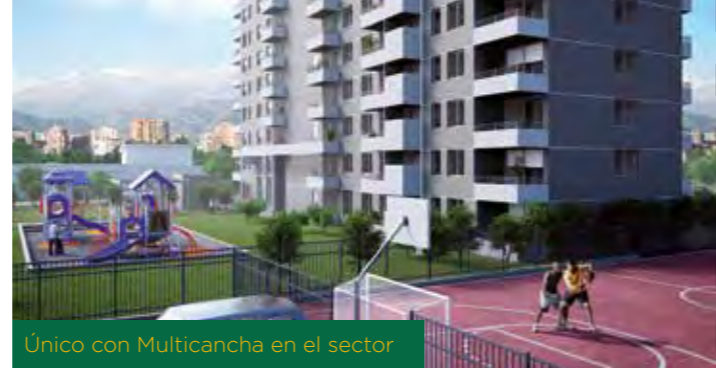
Único con Multicancha en el sector