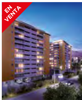
El Matico Vitacura