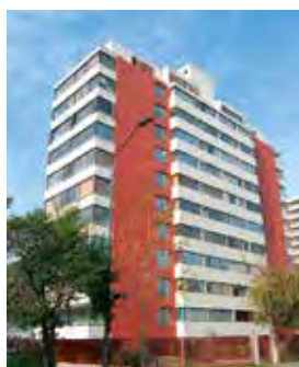
Los Leones Providencia