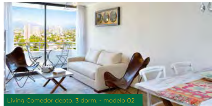
Living Comedor depto. 3 dorm. - modelo 02