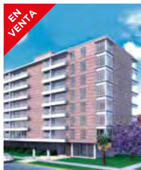
Los Crisantemos Providencia