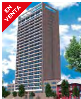
Edificio Blanco Santiago