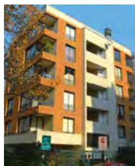
El Canelo Providencia