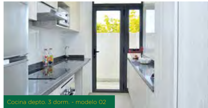
Cocina depto. 3 dorm. - modelo 02