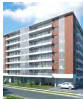
Edificio Henckel Providencia