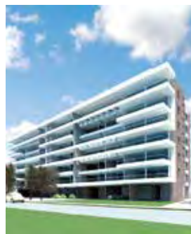
Las Hualtatas Vitacura